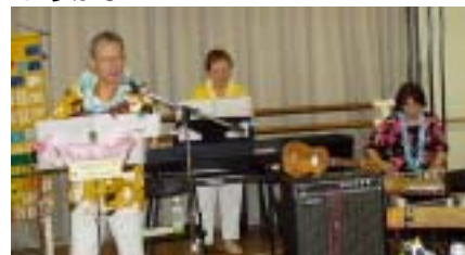
ハニースマイルズの演奏