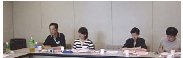
遠藤西日本区広報主任もご臨席