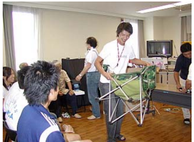
えへへ…ゲットしました。 誰かのスネをかじってゲット。云ってみるもんだ。