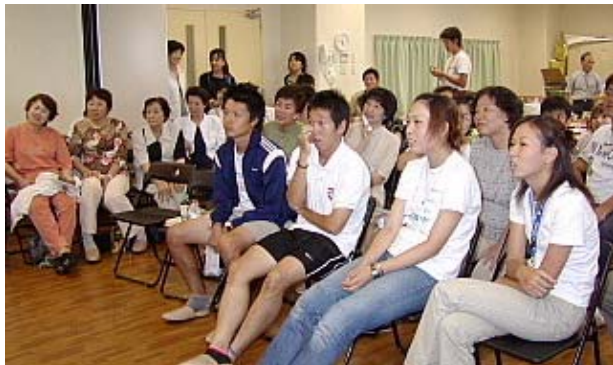
さて、何を買いましょう。1