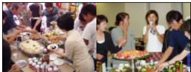
さあ！食べましょう