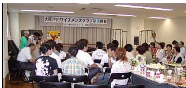
第1部はまじめな例会