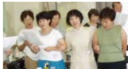
自然に体が動いてしまうわね。