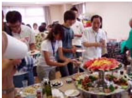
何をたべようかな？