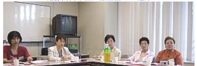
真剣なお顔の参加者たち