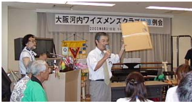
さあ！安いよ 誰か買ってくださいよ