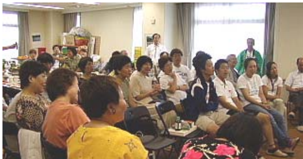
さて、何を買いましょう。2