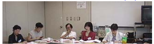
参加者のメネット会長たち ? . . . . .