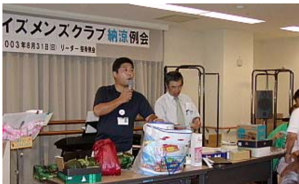
わしがプロのオークショナーです。